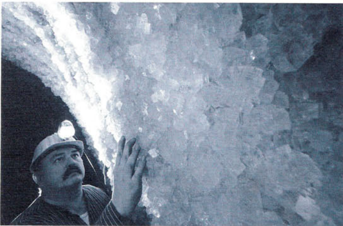
Arbeiter beim Abbau von Salzkristallen

auf einer Fläche von ca. 50 m 2 eine Meersalzgrotte mit Salzen aus unterschiedlichen Gegenden der Welt entstanden, u. a. mit Steinsalzblöcken aus dem Himalaya. 20 Tonnen Salz wurden aus 650 Metern Tiefe aus einem Bergwerk in der Nähe von Warschau herbeigeschafft und Wände und Decken damit verziert, so dass bizarre Gebilde entstanden sind. Der Fußboden besteht aus einer dicken Salzschiicht, die aus dem Toten Meer stammt. Durch das hohe Alter der unterirdischen Lagerstätten ist das Salz frei von Schwermetallen, Ölen, Chemikalien und Strahlenbelastungen, dafür reich an Mineralien und Spurenelementen. Die Kombination aus Meer- und Steinsalz schafft ideale Luftbedingungen, denn Mikroelemente wie Jod, Magnesium, Calcium, Kalium und Brom werden hier freigesetzt und sorgen für die heilende Wirkung. „Die Salzkonzentration in der Atemluft ist sogar höher als am Meer,“ betont Wolfgang Hagemann , Leiter der Gesundheitszentren in Bad Sassendorf. „Bereits ein Besuch von 45 Minuten macht den Organismus widerstandsfähiger.“